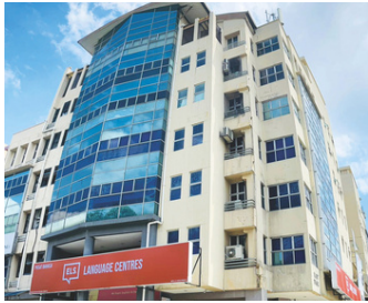
ELS سوبانغ جايا