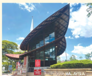
马来西亚博特拉大学 (UPM)