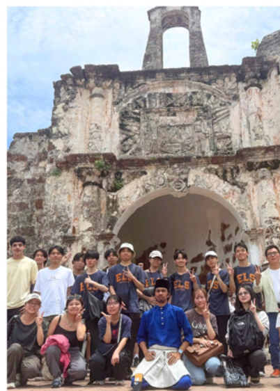
马六甲文化体验之旅