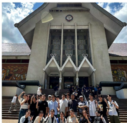
博物馆与艺廊参观