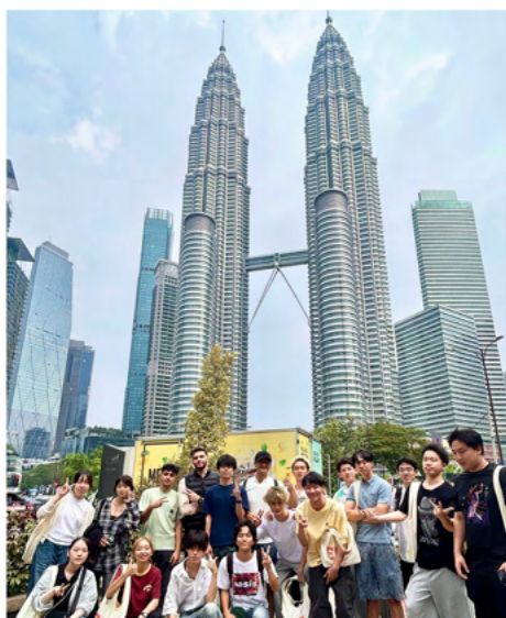
吉隆坡城市探索之旅