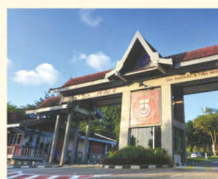
马来西亚工艺大学 (UTM), 柔佛州