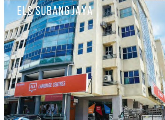
ELS SUBANG JAYA