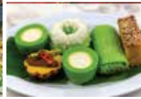
جنا لعشاق الطعام