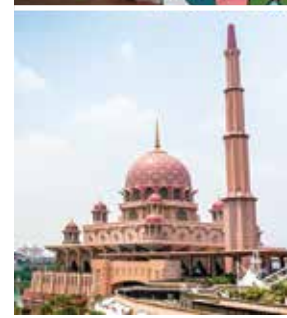
ثقافات غنية ومتنوعة